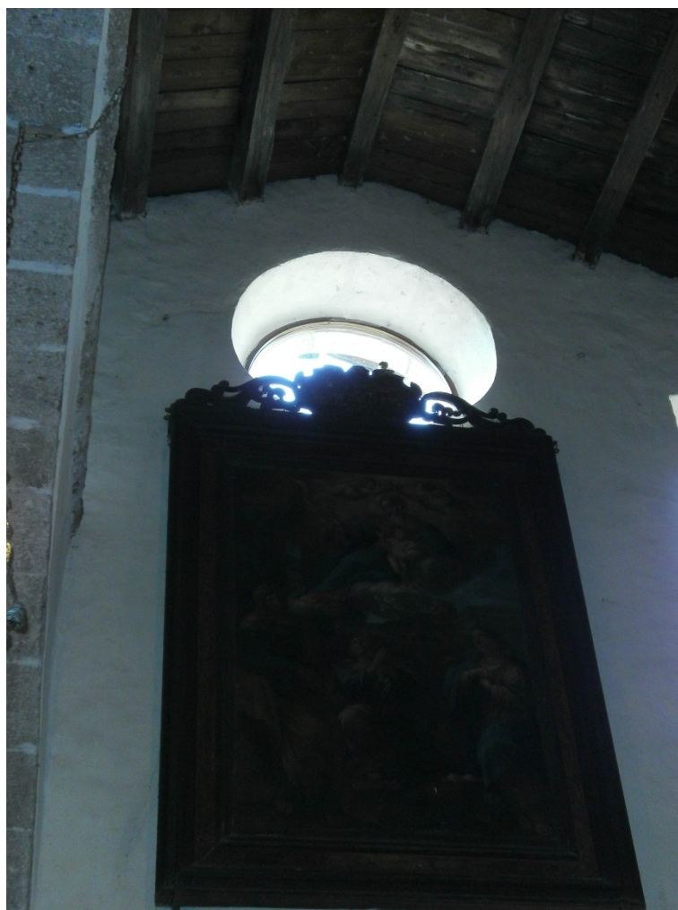
Un insolito, simpaticissimo partecipante al Convegno: un uccellino, forse un usignolo, che dall'alto della cornice di un grande quadro posto sopra la porta d'ingresso della chiesa ci ha rallegrato con il suo canto melodioso. (speriamo che, alla fine, sia riuscito a trovare la via per ritornare all'aperto)