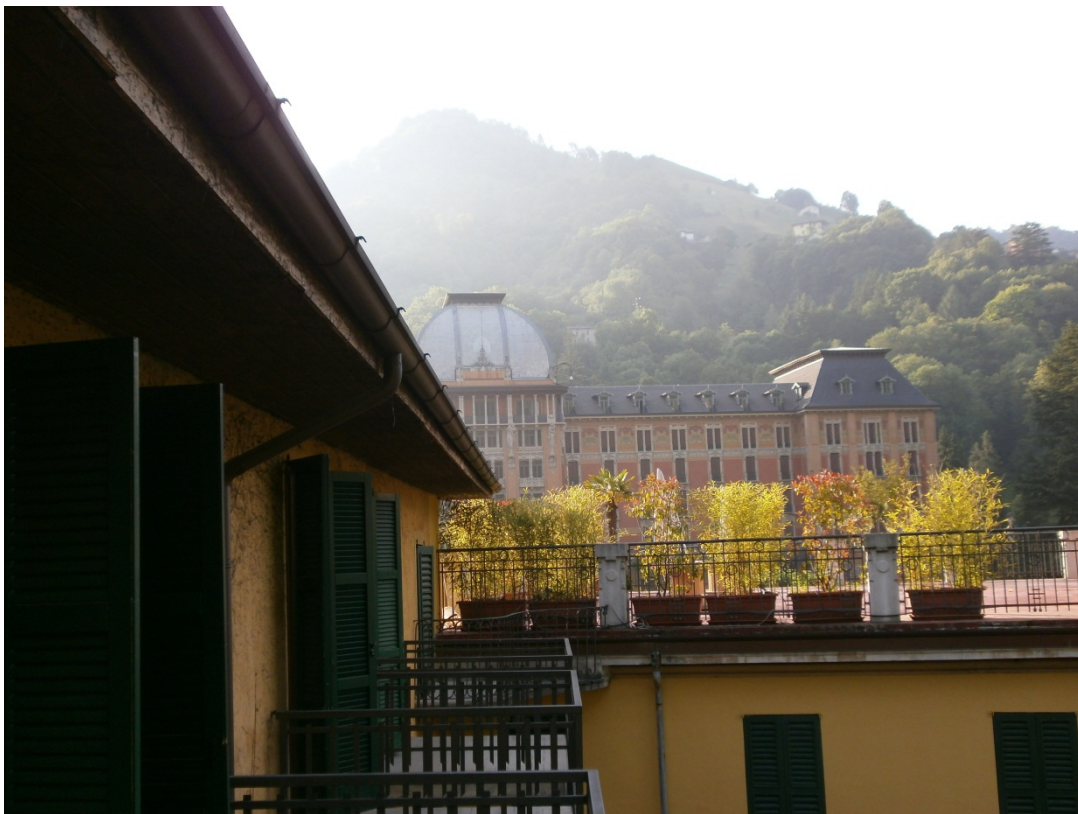
Dalla mia stanza al mattino: alla sinistra il Grand Hotel di San Pellegrino Terme