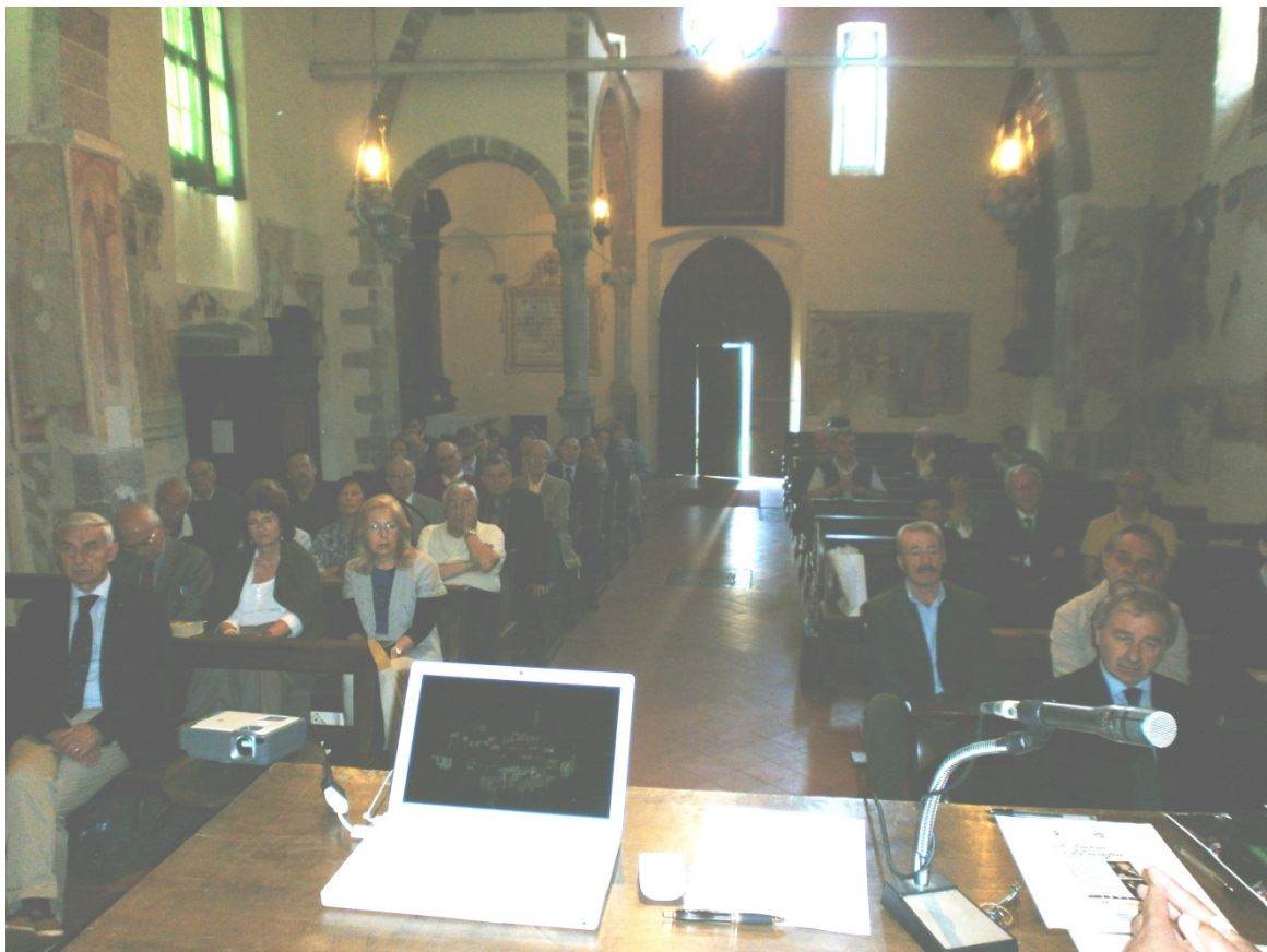
Una parte del pubblico (qualche delegazione dall'estero deve ancora arrivare)