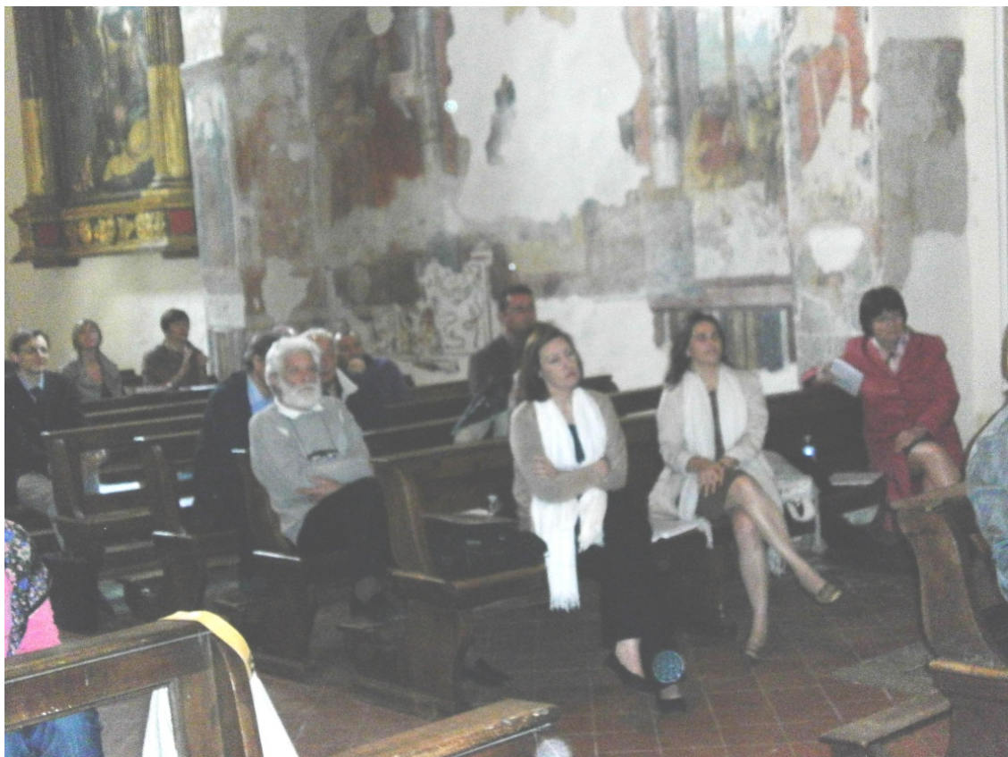
Una parte del pubblico con partecipanti di Valencia e Innsbruck in prima fila