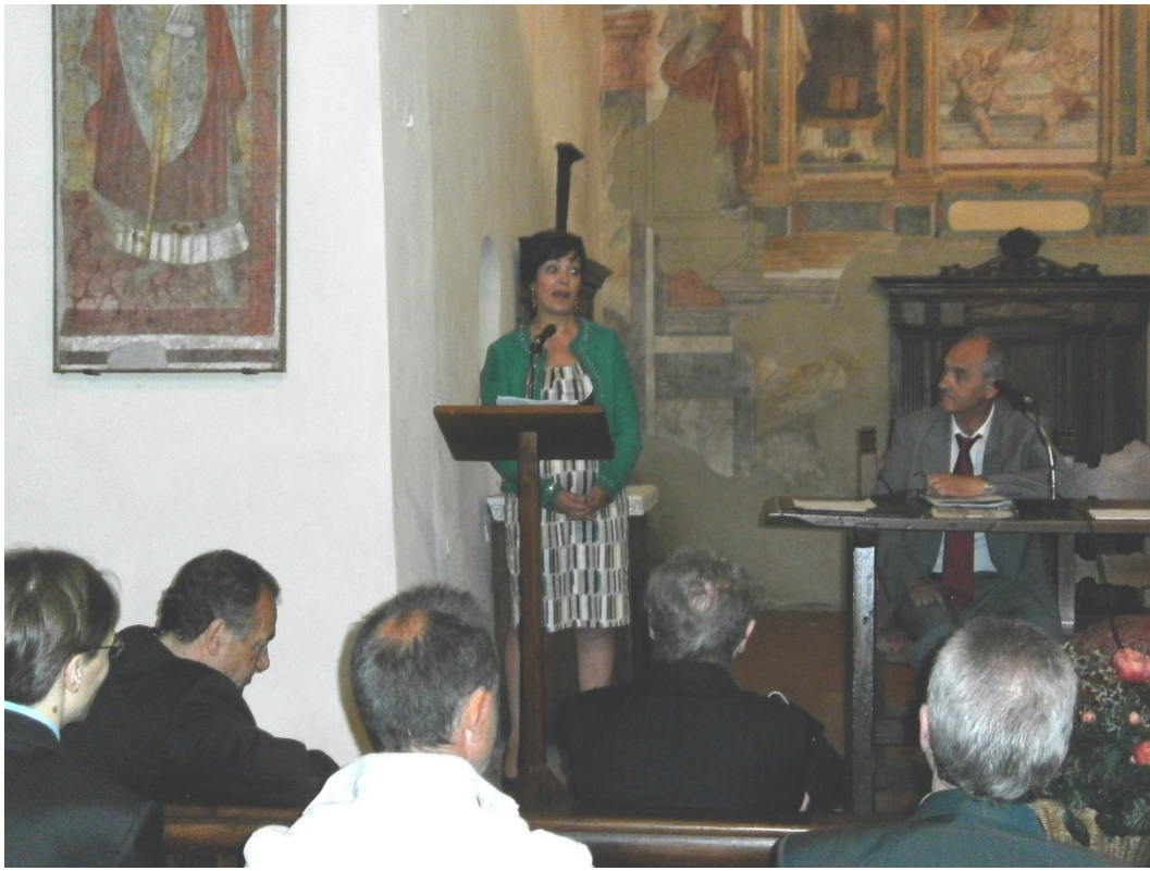
Il saluto di Poste Italiane