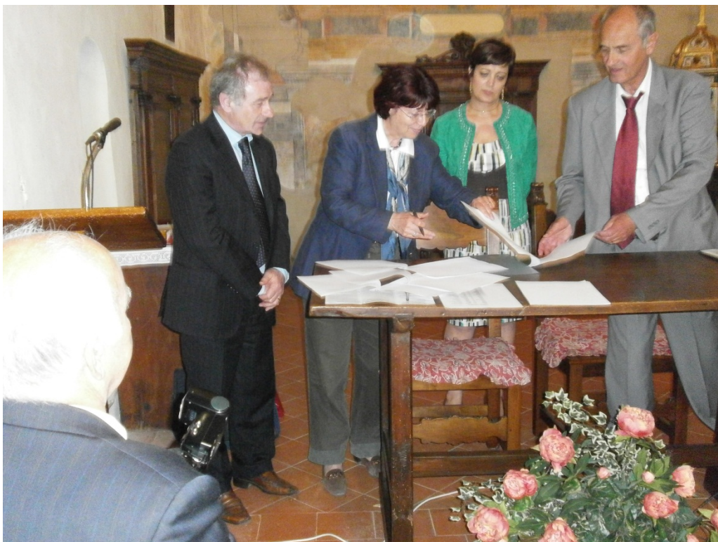
La firma dell'accordo tra Cornello e l'Università di Innsbruck per borse di studio per ricerche sui Tasso